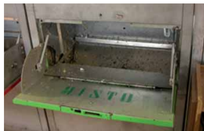
Tramoggia dell'umido e del secco indistinto

La tramoggia si utilizza inserendo nella corretta fessura la scheda magnetica avuta in dotazione, digitare il pin cod personale e il tipo di sportello da aprire, lo sportello si aprirà per metà ed un messaggio vocale indicherà di aprire lo sportello e conferire il materiale all'interno della tramoggia e di richiudere lo sportello; la macchina eseguirà il test d'idoneità ed in caso affermativo rilascerà uno scontrino con il peso del materiale conferito ed il bonus maturato, da accreditare sul conto del cittadino e la stessa cosa deve avvenire con le altre tre tramogge. Il cittadino ha così terminato il suo iter e si ritroverà con eventuali 4