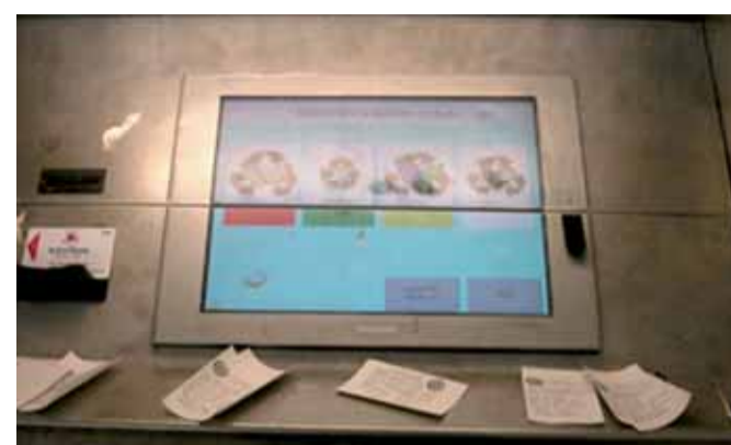
L'ingresso dei rifiuti è regolato dalla tessera magnetica che registrerà direttamente alla sede di gestione del servizio

omogenea. In una fase successiva, il materiale verrà rovesciato in una serie di spappolatori per ottenere un impatto il più uniforme possibile. All'arrivo di nuova carta, l'impasto passerà al secondo e poi al terzo spappolatore dove con diluizioni crescenti, verrà depurato da alcuni contaminanti quali inchiostro, sabbia ed eventuale ferro. Dall'ultimo dei tre pulper, l'impasto verrà collocato previa compattazione, in un serbatoio dal quale verrà prelevato a tempo dovuto per essere portato in cartiera.